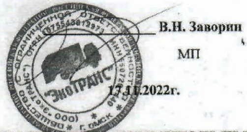
График сбора и вывоза твердых коммунальных отходов (ТКО) в с. Красный Партизан Чарышского района Алтайского Края